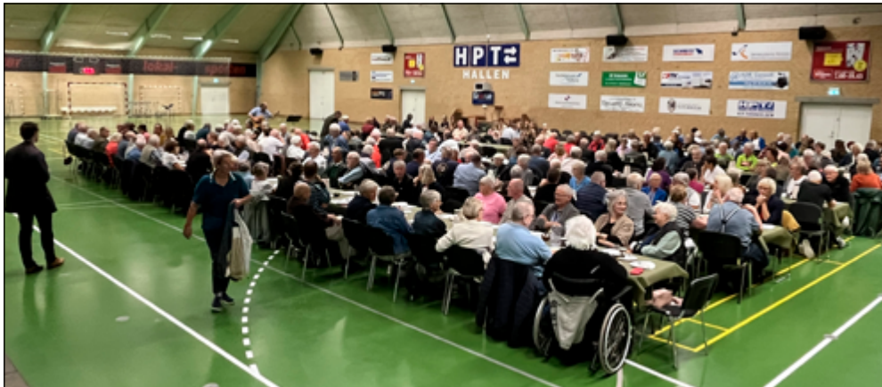
Messen startede med fælles morgenkaffe i een af Grænsehallerne.