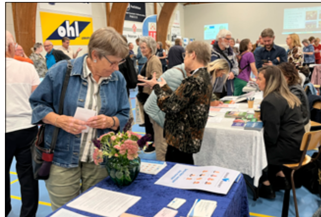
Der var mange som fik en dialog med standen med Borgerservice.