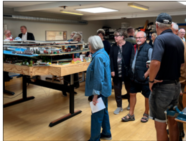
Der var stor interesse for togklubben for modeljernbane.

Cykelklub, Spillecafé, Badminton 60+, Petanque, Kruså Vandmølle, Grænseegnens Marchforening, folkedansere fra Grænsekvadrillen, Roklub, "Kom ud mand", Lions Club Bov, Togklub for modeljernbane, Reparations-cafe, Skytteforeningen, Socialdienst Nordschleswig og aktiviteter i Ældre Sagen Bov. ■