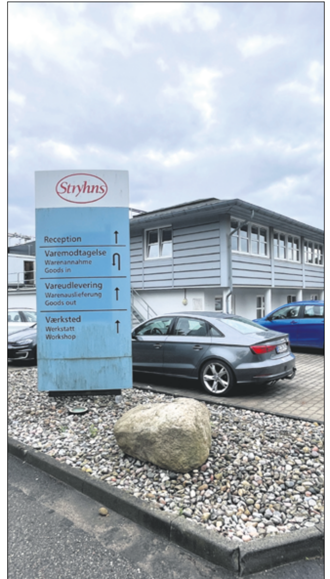
Stryhns fabrik i Gråsten får ny fabrikschef.