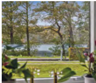
Rækkehus med kort afstand til Gråsten bymidte og udsigt til skoven og slotssøen