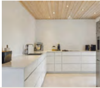
Moderniseret villa i attraktive Alnor