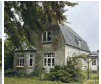
Villa til hurtig overtagelse med ekstra grund på 447 m 2 med bygning til lager