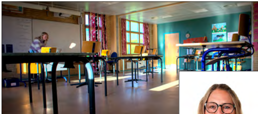
Gråsten Skole skal renoveres, men der sker først noget i 2027.

“Vi er i gang med at lave et skitseforslag. I foråret bliver der et forældremøde om, hvad skitserne indeholder, og hvad ombygningen kommer til at indebære for de fysiske rammer og den daglige skolegang,” siger skole-