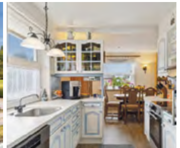
Villa i et plan nær den dansk/tyske grænse