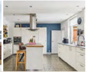
Charmerende rødstensvilla centralt i Gråsten