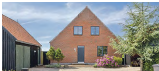
Unik og gennemført bolig i populære Dyrhøj