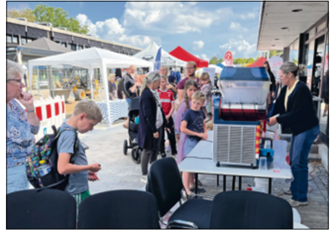
Der var kø ved slush ice- og popcorn maskinen.

Padborg Torvecenter med gode tilbud og gæstestiver, og det var en festlig