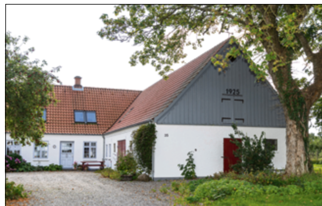
Der blev udstykket 20 husmandssteder i 1925, som i dag er blevet til fritidslandbrug.

I 1925 blev der udstykket 20 statshusmandssteder fra Fiskbæk avlsgårds jorde langs med Fiskbækvej og Bojskovvej, vest og nordvest for landbrugsskolen. ■