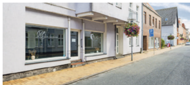
Spændende mulighed - tidligere frisørsalon med potentiale for omdannelse til bolig