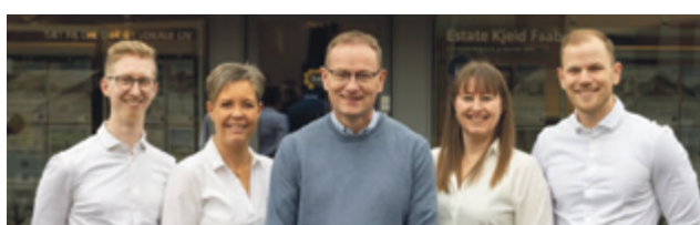
Estate Gråsten, Kjeld Faaborg