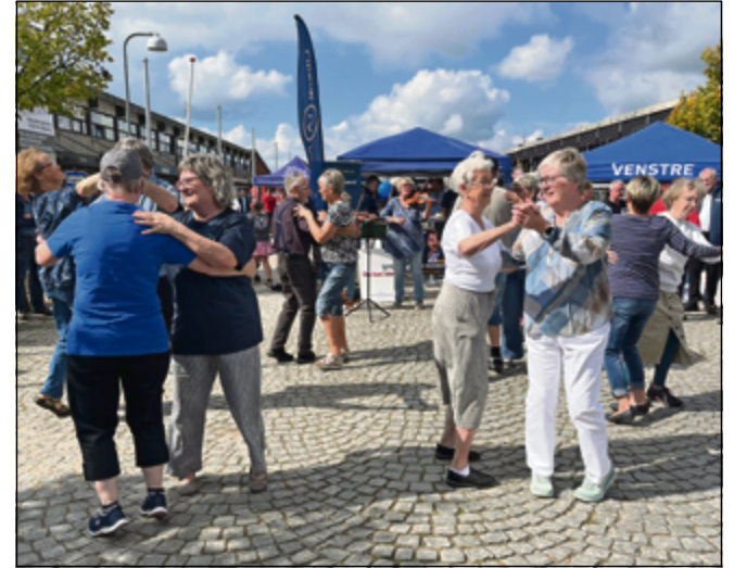
Grænekvadrillen gav opvisning på Folkedans.