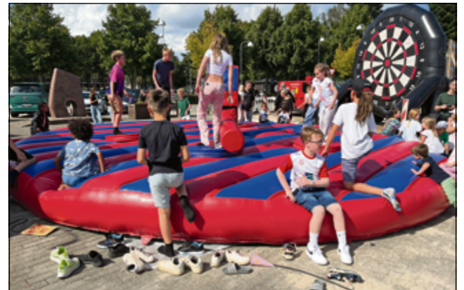
Børnene hyggede sig med forskellige aktiviteter.