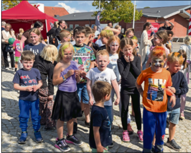
Børnene venter på skumkanonen.