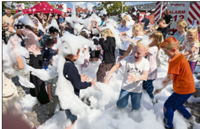
Skumkanonen var dagens højdepunkt.