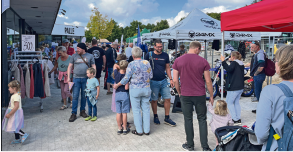
Flere hundrede mennesker hyggede sig til familiefesten