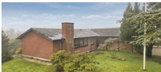
Bud ønskes - skal sælges nu.