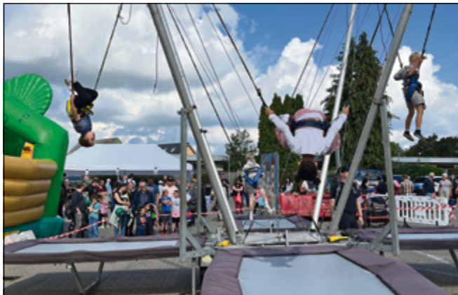
Bungee trampolinen var meget populær.

og fornøjelig dag, som arrangørerne kan være stolte af. ■