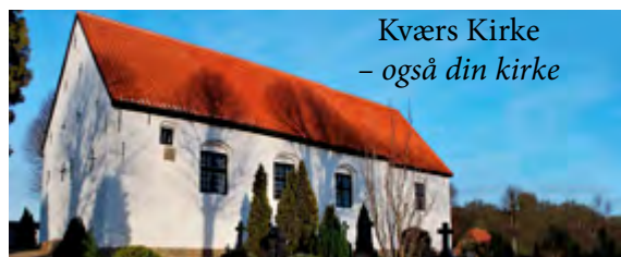
Kværs Kirke – også din kirke