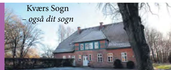
Kværs Sogn – også dit sogn