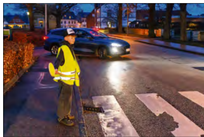
Skolepatruljens arbejde med at skabe mere tryghed på skolevejen for de yngste børn bliver værdsat på Gråsten Skole.

Det begyndte i 1949 at ordningen med skolepatruljer for første gang så dagens lys. ■