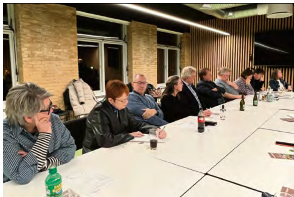
Generalforsamlingen i Gråsten Handel var velbesøgt.