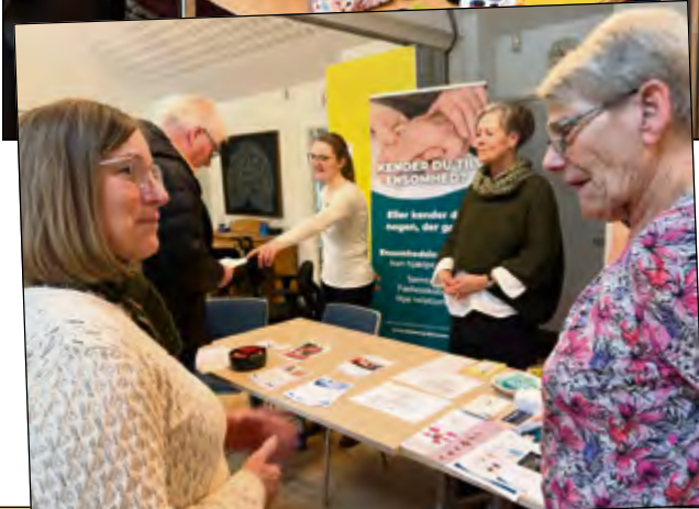
Folk fik interessante samtaler med medarbejdere fra Aabenraa Kommune om det gode seniorliv.