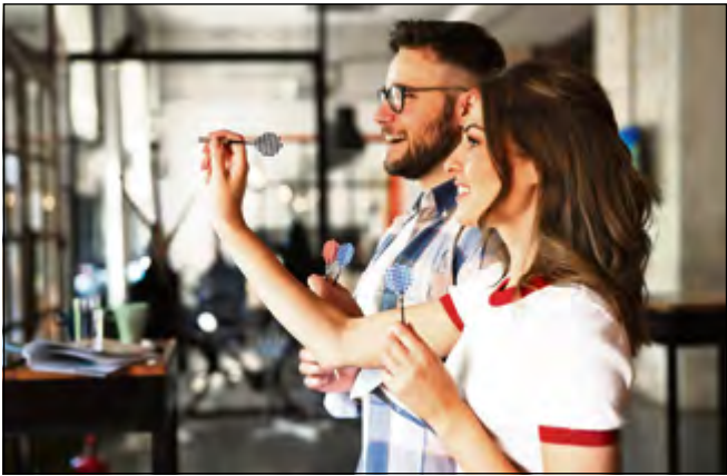
Padborg Dart Club holder åbent hus på søndag.