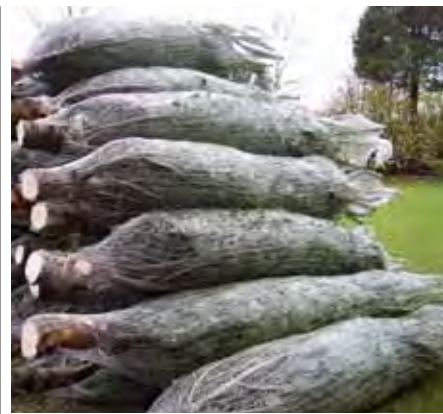
Juletræerne sælges i net for at lette transporten.

- Det er alt sammen meget sjovt, men også hårdt, forsikrer den fotogene pige. ■